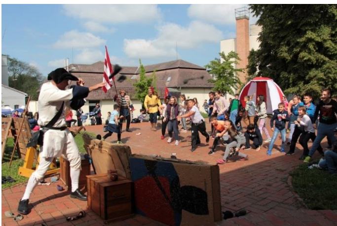
Küzdelem a „harctéren”