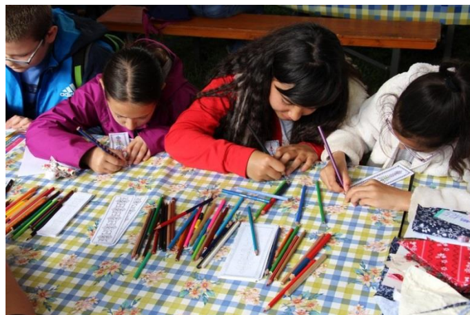
Jász mintás könyvjelző készítése