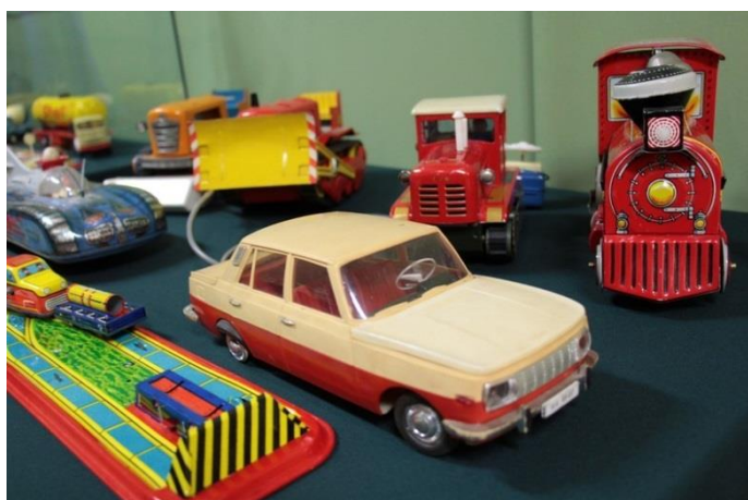
Fiú játékok az 1960-70-es évekből