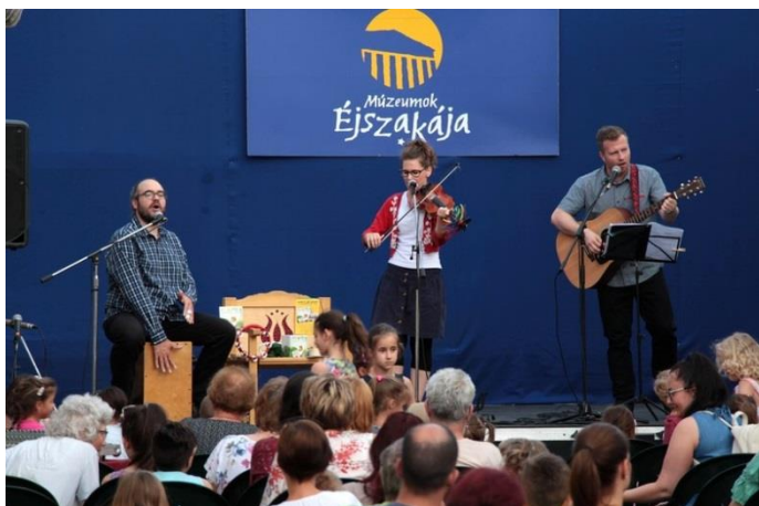
A Lóca együttes műsora