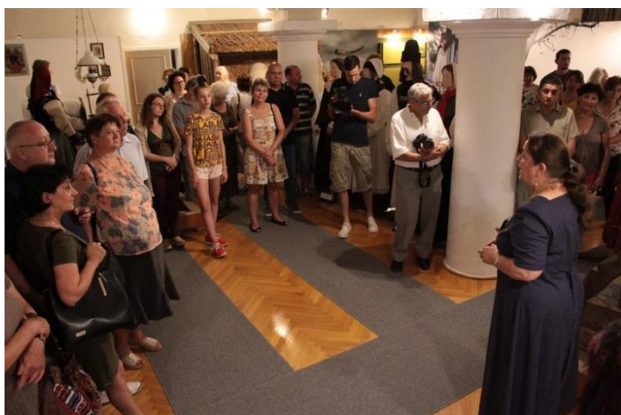
„Párlatvezetés” a Jász Múzeum állandó kiállításában