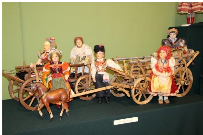
Viseletes babák a 20. század elejéről