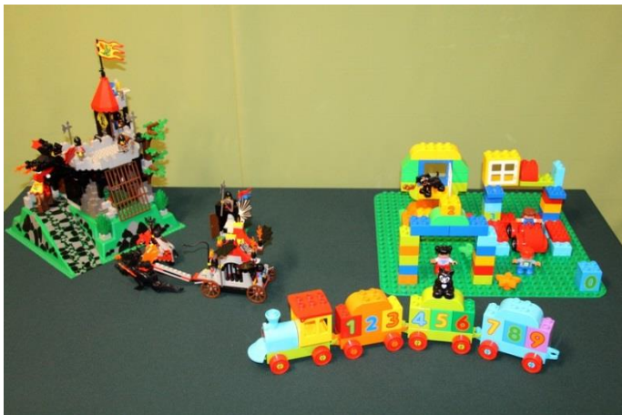
Különféle LEGO típusok a kiállításban