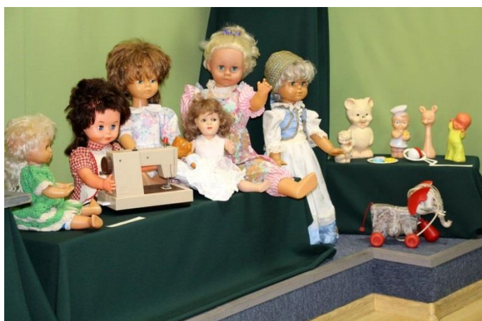
Babák az 1960-70-es évekből