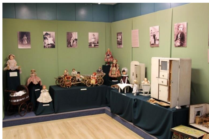
Részlet a kiállításból