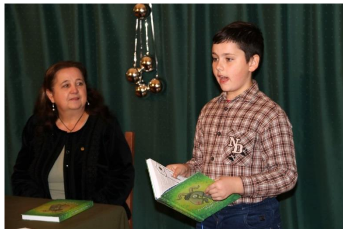
A félig nyúzott bakkecske című könyv bemutatója