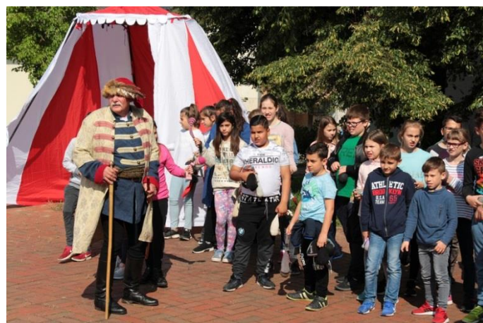
Rákóczi fejedelem és csapata