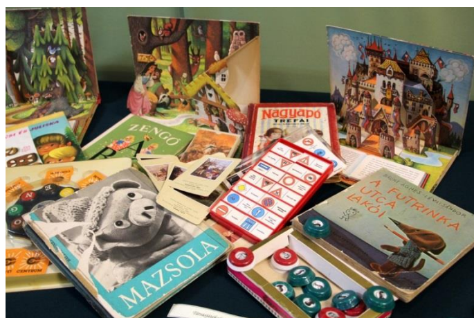
Társasjátékok és mesekönyvek