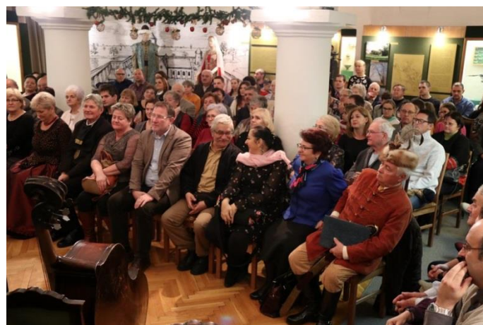
A koncert közönsége a Jász Múzeumban