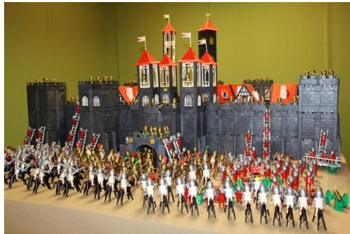
Schenk Károly várépítő játéka