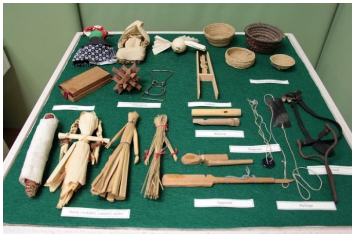
Régi idők játéka