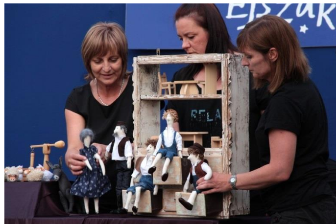
Kelepelő Bábcsoport előadása