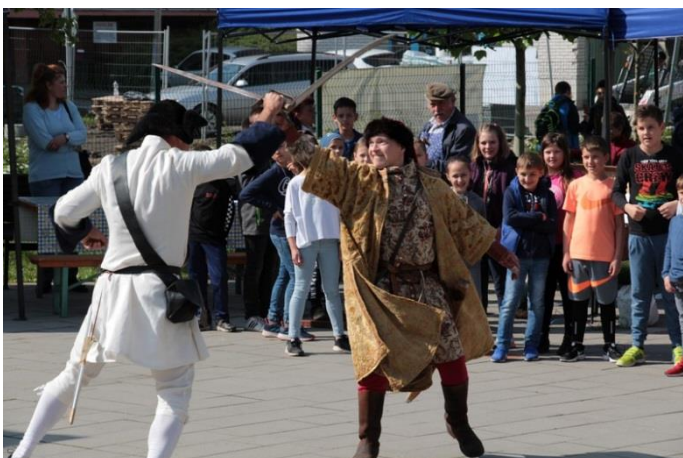
Kuruc labanc küzdelem