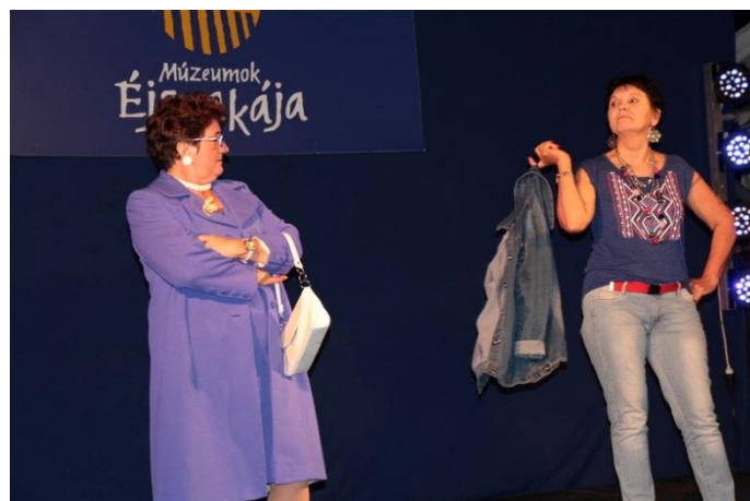
A Jászsági Hagyományörző Egylet műsora