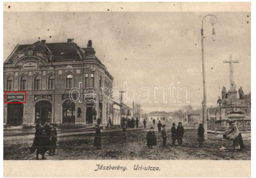
A pirossal megjelölt helyen volt a Spagatner ékszerbolt