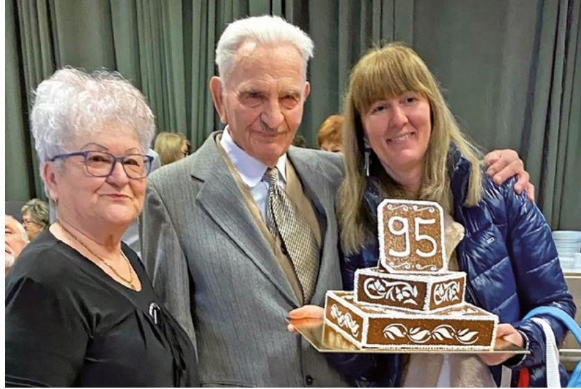
Az ünnepelt lányával és unokájával