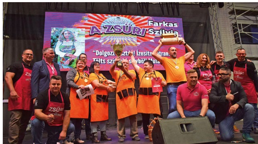
Az idei győztes Rock a bélbe csapata, a szervezők és a zsűri

A nyolcadik Jász Kolbásztöltő Fesztivált rendezték február 14-15-én a JP Arénában és a csarnok környékén. Az érdeklődés a két nap alatt óriási volt, pedig az elmúlt évi fesztiválok adatai szerint a látogatottság, mondhatjuk úgy is, hogy a fizetőképes kereslet visszaesett. Nos, ezt nem lehetett észrevenni a JP Arénában, ahol a péntek és a szombat esti-éjszakai programokon is sokan voltak. A szombati kolbásztöltés pedig idén is frenetikus hangulattal sikeredett.