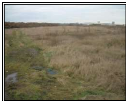
2009. évi állapot